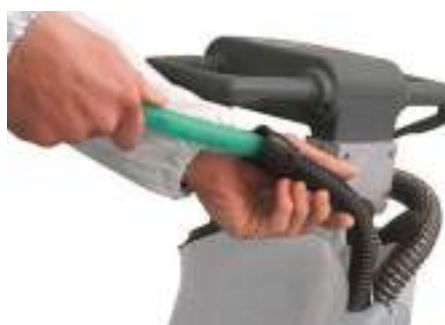
Vispa 35 B-BS Pulizia periodica del tubo tergovivamento per garantire un'efficiente aspirazione