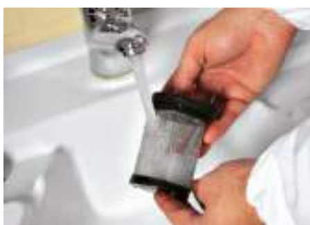
Vispa 35 E-B-BS Pulizia totale del filtro di aspirazione semplice e pratica