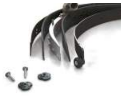
Vispa 35 E-B-BS Per ottenere una buona asciugatura è necessario mantenere sempre pulite le gomme tergovivamento. La loro sostituzione in caso di usura risulta essere molto semplice