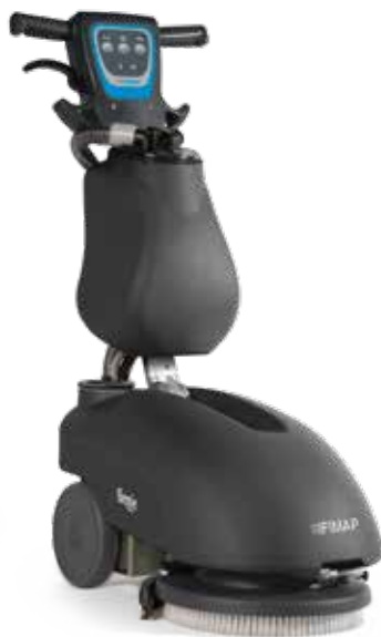
🔋 Genie B