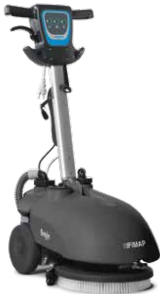
🔌 Genie E

Genie può rivoluzionare il mercato della pulizia tradizionale dal momento che il 90% delle superfici inferiori a 1000 m 2 è ancora pulito con sistemi manuali che risultano molto costosi e poco efficaci.