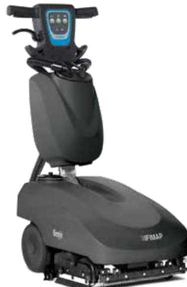
🔋 Genie Bs