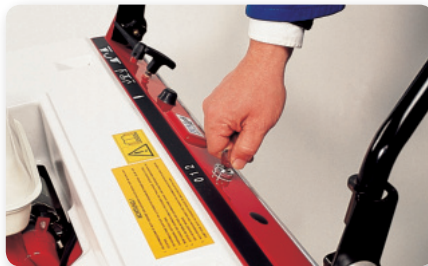
Scuotitore elettrico Electric filter shaker Sacudidor de filtro eléctrico