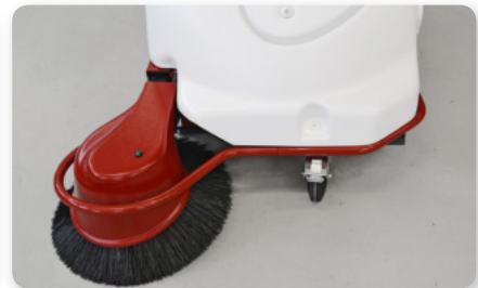
Paraurti Bumper Parachoques