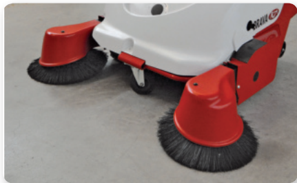
Braccio spazzola laterale sinistro Left side brush arm Brazo lateral izquierda