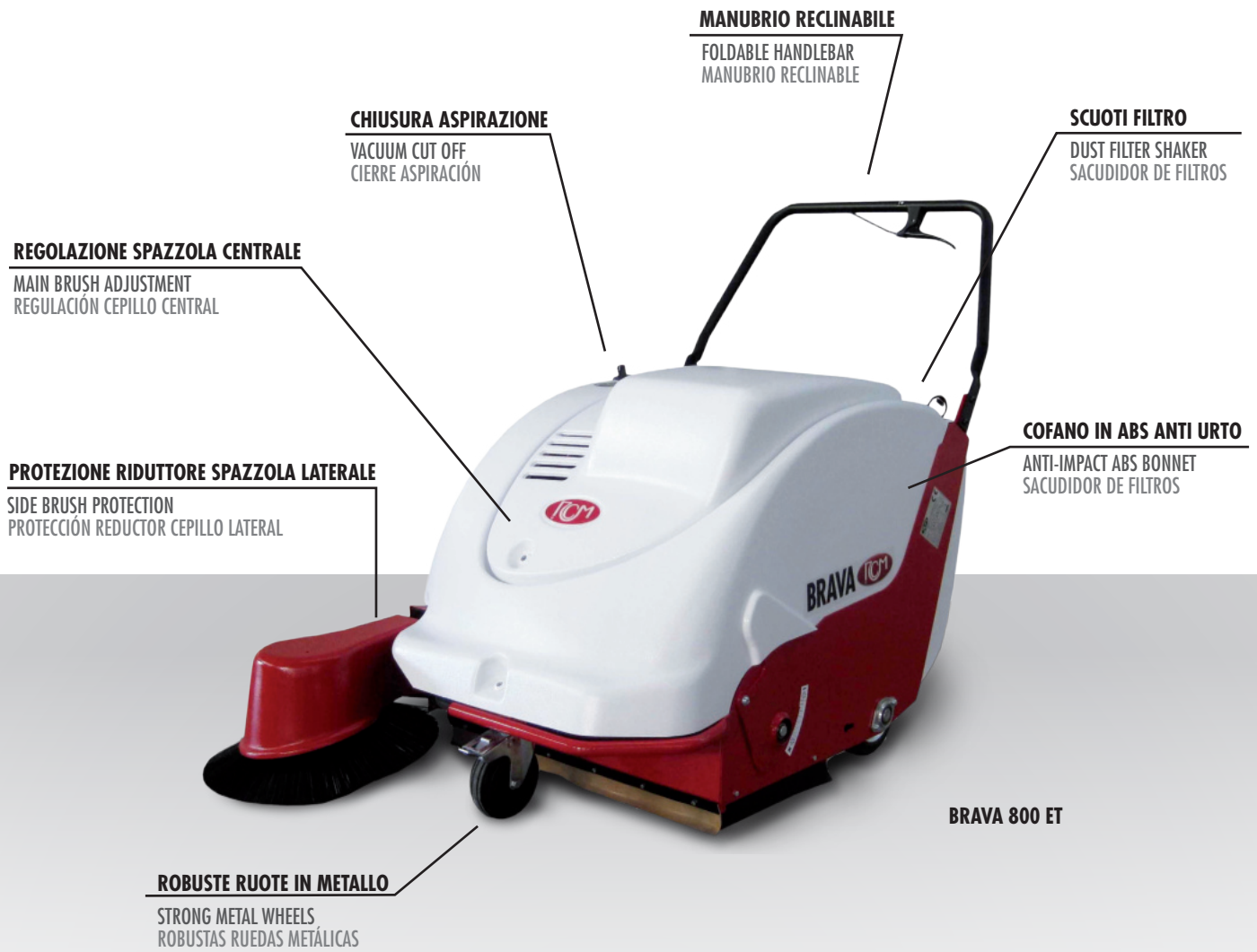
BRAVA 800 ET