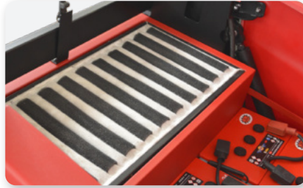
Kit filtro multitasche Polyester sack filter kit Kit de filtro de saco de poliéster