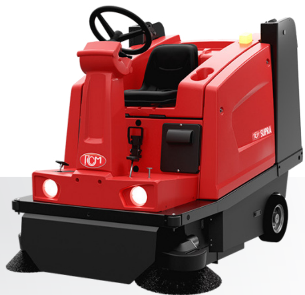
SUPRA E SA Scarico idraulico Hydraulic dumping Descarga hidráulico