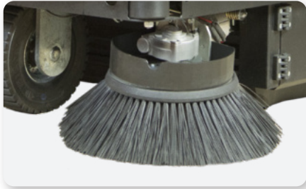
Braccio spazzola laterale sinistro Left side brush arm Brazo lateral izquierda