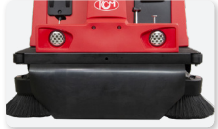
Convogliatore polvere Dust conveyor Encaminador de polvo