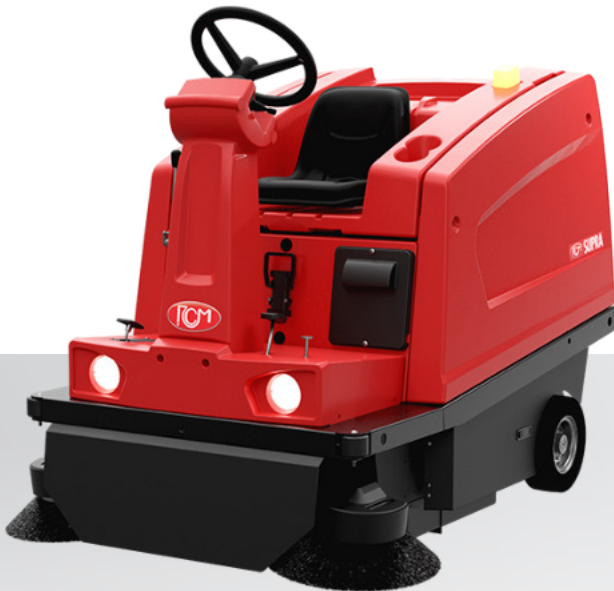
SUPRA E Scarico manuale Manual dumping Descarga manual