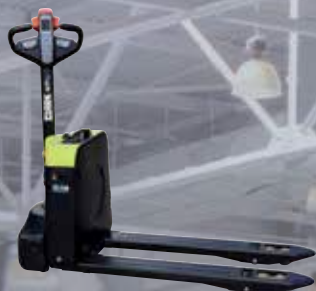
Transpallet elettrico 1800 kg