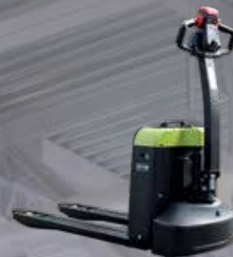
Transpallet elettrico 1500 kg