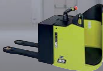
Transpallet con piattaforma fissa 2000 kg