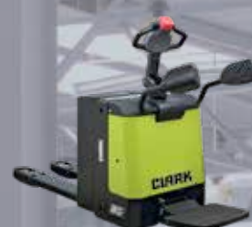
Transpallet elettrico con piattaforma pieghevole 2000 kg