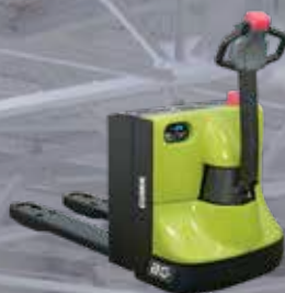
Transpallet elettrico 2000 kg