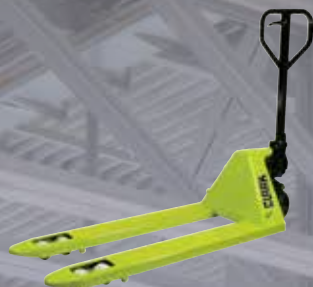
Transpallet manuale 2500 kg