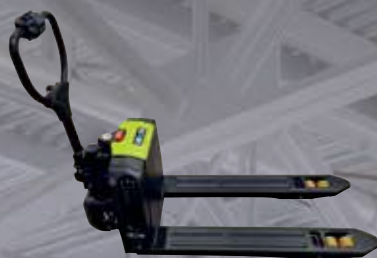
Transpallet elettrico 1500 kg